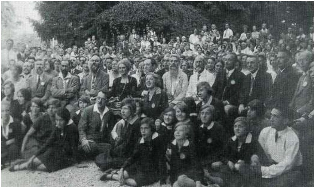
Congrés de la Lliga Internacional de la Nova Educació, l'any 1927, a Locarno

El 1922 va fer un viatge d'estudis a EEUU per treballar i reflexionar sobre aquesta nova educació